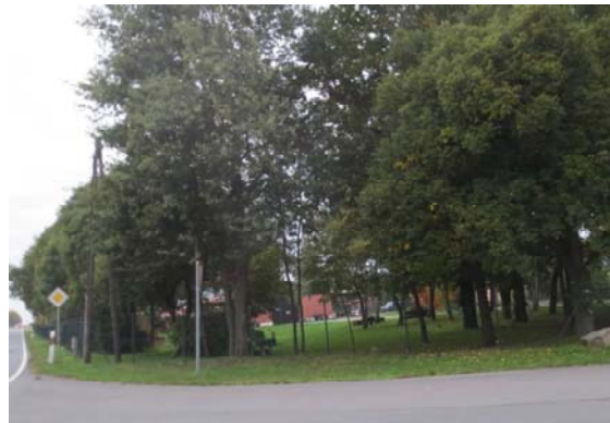
2013: Die letzten authentischen Reste, die Pfeiler, sind vernichtet – nach 68 Jahren im Jahr der geplanten Aufstellung einer Mahn- und Gedenktafel .