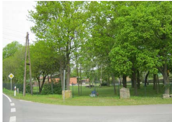
2012: Blick aufs ehemalige Lagertor. Die Stümpfe der damals übermannshohen Torpfosten sind erhalten, ganz rechts liegt ein Teil eines der Torpfosten. Schon zur Zeit des RAD-Lagers befand sich links an der Straße ein Strommast, wie auch heute noch.