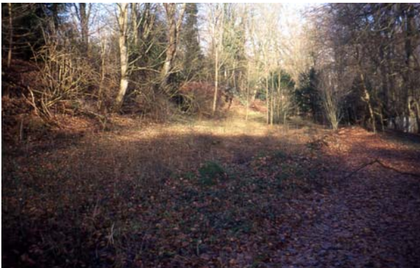
Das eingeebnete Gräberfeld C I um 2000

Knapp 30 Jahre nach der Einebnung, im Jahr 2005, erforschten Schüler eines Leistungskurses Geschichte des Albert-Einstein-Gymnasiums die Geschichte des Gräberfeldes C I und machten es durch eine Tafel kenntlich.