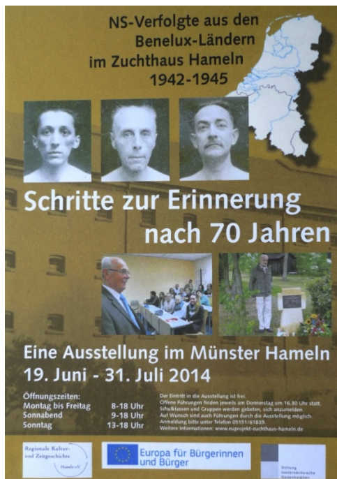
Plakat des Projekts „Bürger aus den Benelux-Staaten als NS-Verfolgte im Zuchthaus Hameln 1942-1945“