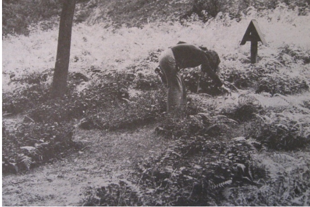
Das Gräberfeld im Jahre 1975

Die Beseitigung des Gräberfeldes C I ist im Kontext mit der gleichzeitigen Erhaltung des benachbarten Gräberfeldes C III zu sehen. Auf C III waren in den Jahren 1945 bis 1949 insgesamt 200 Männer und Frauen bestattet worden, welche die britische Besatzungsmacht hingerichtet hatte.