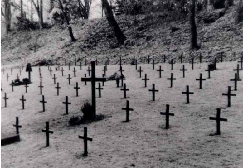
Das von der Bürgerinitiative gestaltete Gräberfeld C III in den 1980er Jahren

Später wurde öffentlich, dass die BI enge Verbindungen zur NPD und zu Neo-Nazis hatte. Als es 1985 und 1986 zu Demonstrationen und Gegendemonstrationen an den Gräbern kam und Hameln in der überregionalen Presse negative Schlagzeilen machte, ließ die Stadt das Gräberfeld C III am Morgen des 5. März 1986 eiebenen.