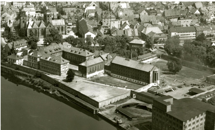
Das Zuchthaus Hameln in den 1960er Jahren

In den Jahren 1933 bis 1945 saßen im Zuchthaus Hameln mehrheitlich aus politischen und rassistischen Gründen verurteilte Männer ein.