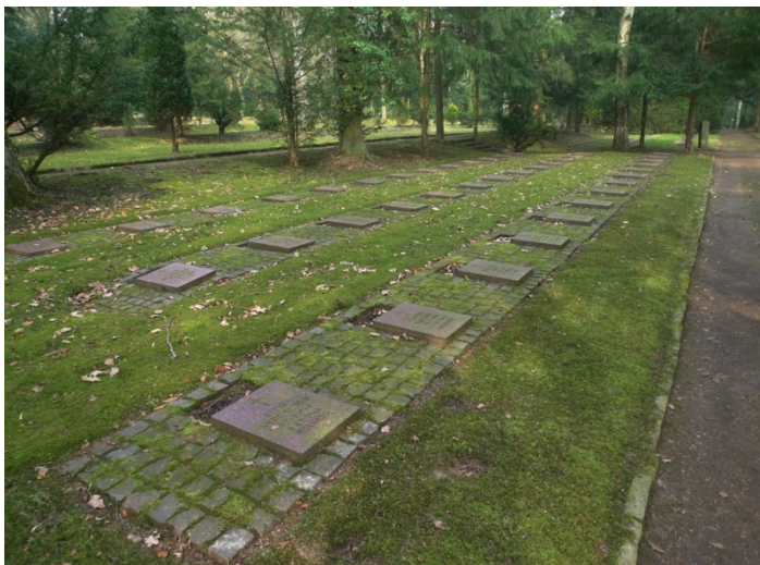
Das 1972 angelegte Gräberfeld F II für anerkannte Gräber im Sinne des Kriegsgräbergesetzes auf dem Friedhof Wehl

1972 legte die Zuchthausverwaltung auf eine entsprechende Aufforderung des Regierungspräsidenten „anerkannte Gräber im Sinne des Kriegsgräbergesetzes“ von ausländischen Kriegsoffizieren (Zwangsarbeiter und Zuchthausinsassen) auf dem neu angelegten Feld F II zusammen. Sie hatten bisher verstreut auf dem Friedhof Wehl gelegen, mehrere auch auf Feld C I.