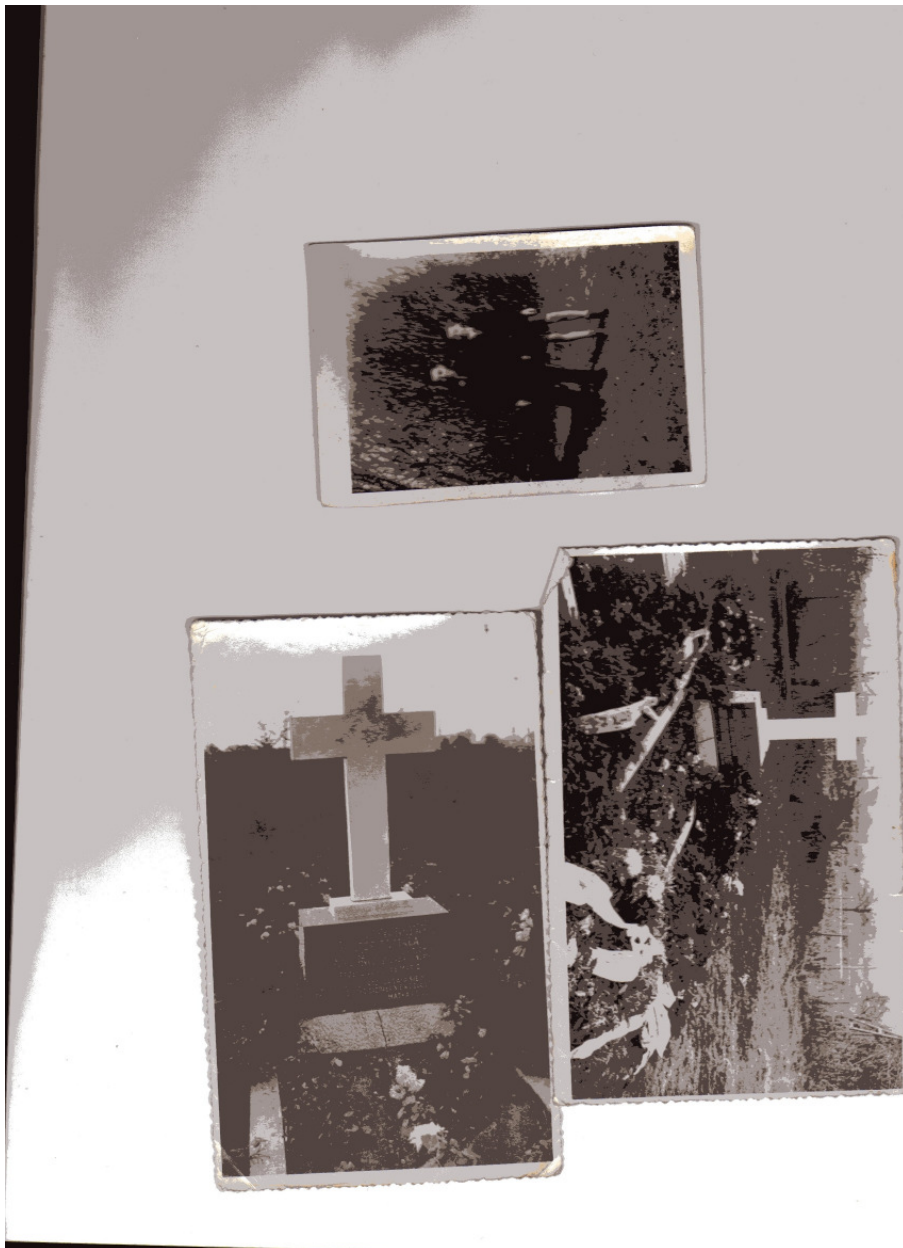
Ein Bild vom jungen Wiktor Tomala und 2 Grabfotos!