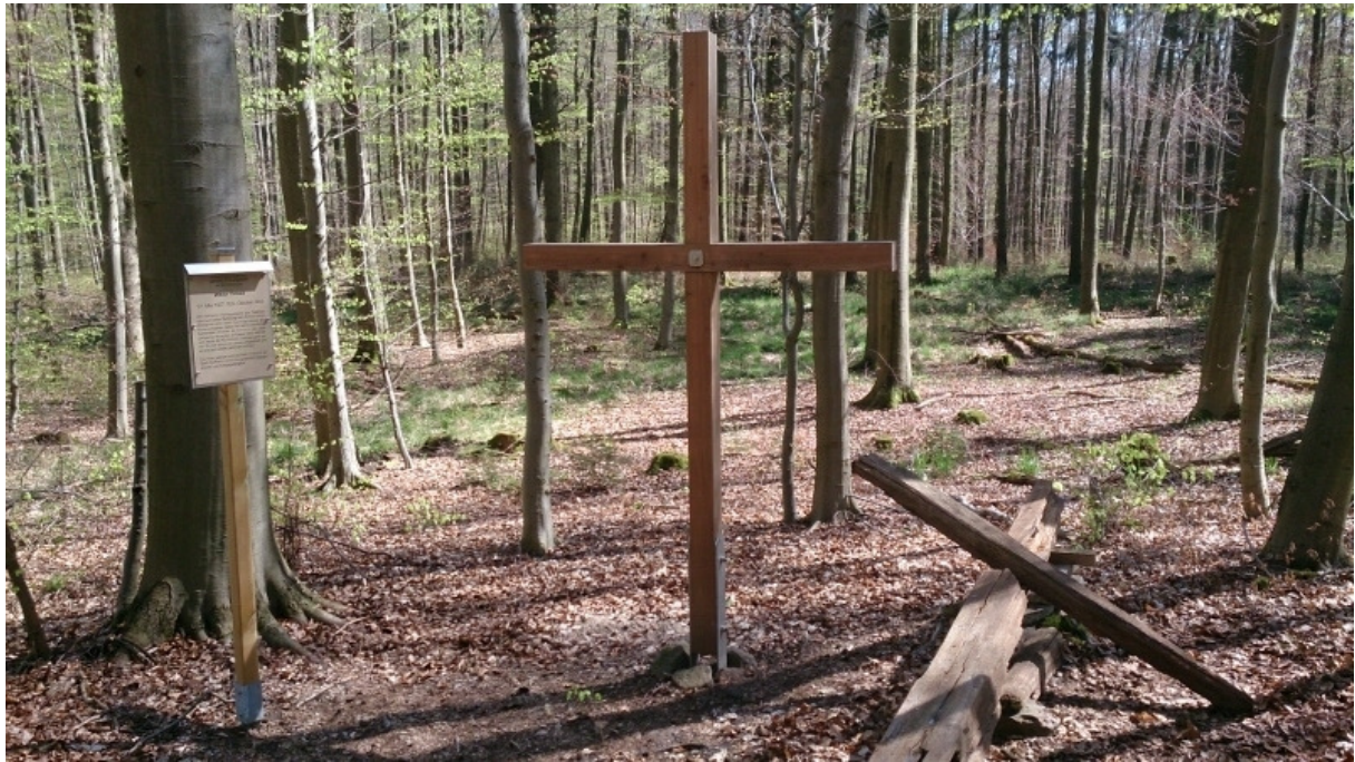
Sommer 2014: das neue „Polenkreuz“ (mit Tafel)