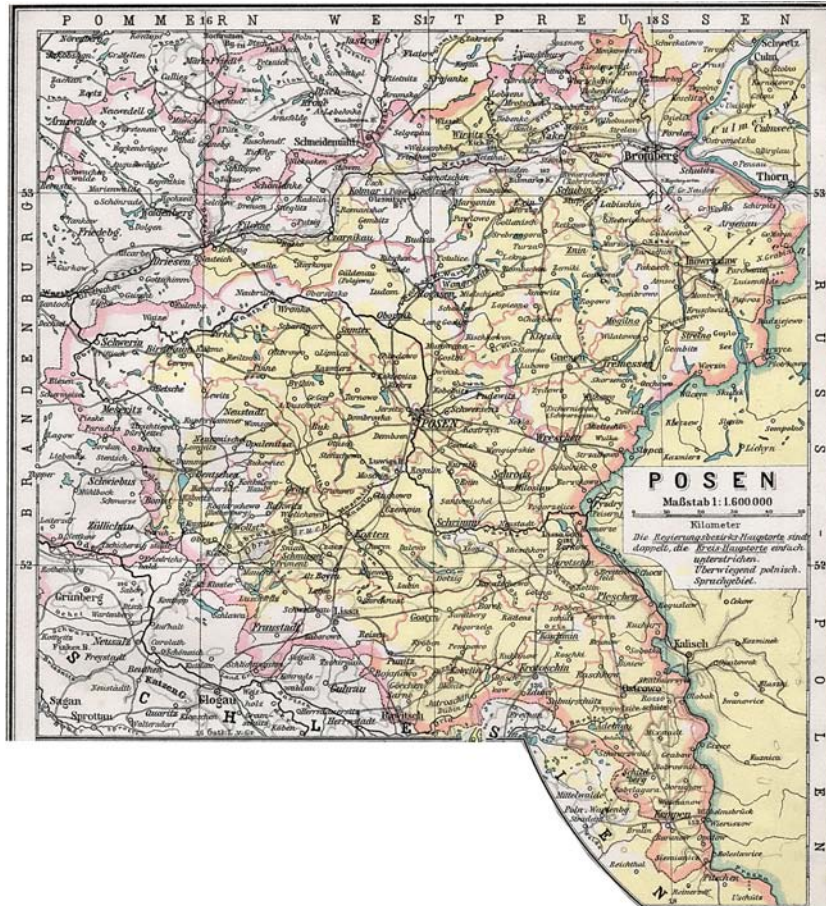
Lage von Teklinów/damaliger Kreis Kempen