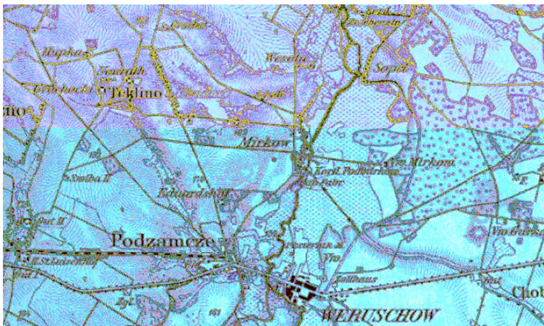
Wieruszow und Teklino(w) auf einer dt. Karte von 1892