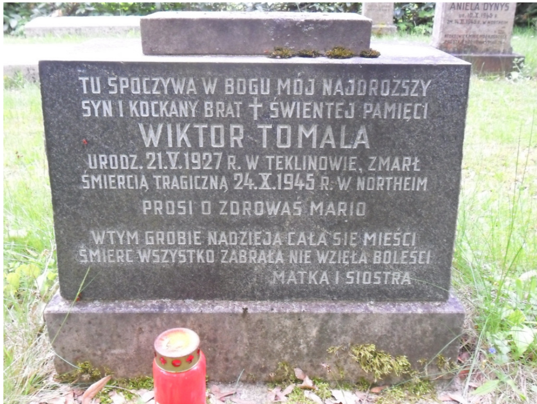
Grabfeld 6b Friedhof Northeim