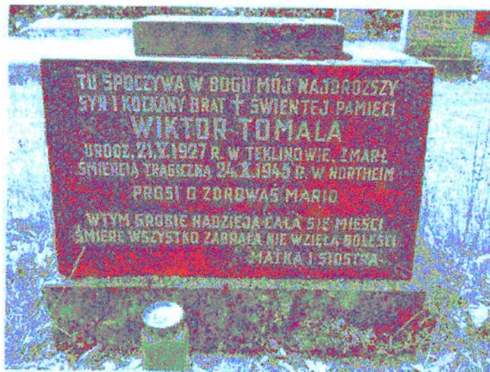
Der Grabstein auf dem Northeimer Friedhof